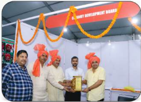
Coconut Development Board