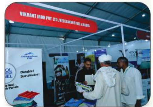
Vikrant Iron Pvt. Ltd./ Neelkanth Steel & Alloys