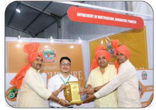
Department Of Horticulture, Arunachal Pradesh