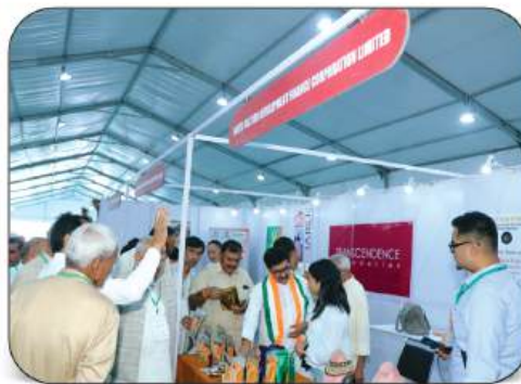
North Eastern Department Finance Corporation Limited