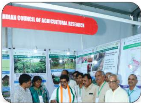
Indian Council Of Agricultural Research