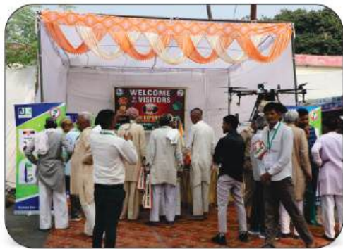
J K Krishi Export Pvt. Ltd.