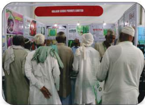
Kalash Seeds Pvt. Ltd.