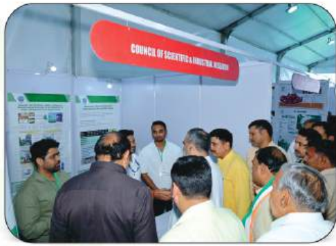
Council of Scientific & Industrial Research