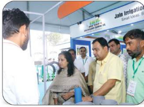
Jain Irrigation Systems Ltd.