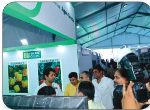
Sabar Agro Seeds