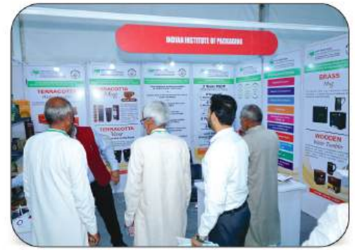
Indian Institute of Packaging