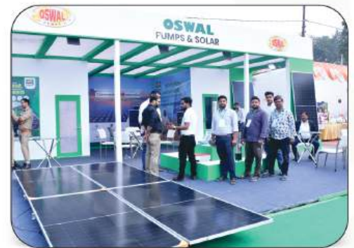
Oswal Pumps & Solar