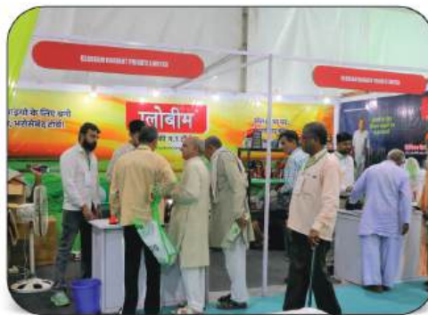
Globeam Radiant Pvt. Ltd.