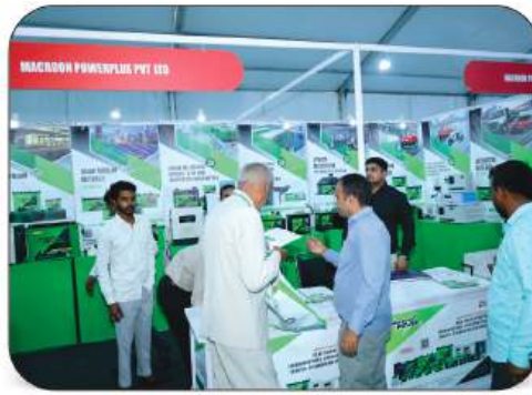
Macroon Powerplus Pvt. Ltd.