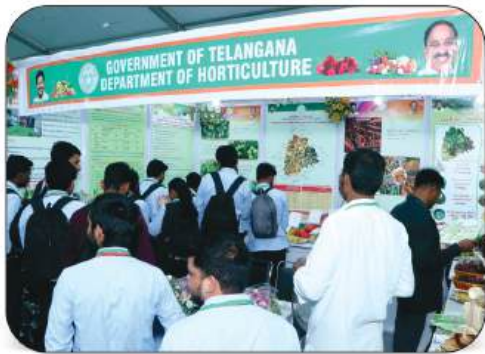
Govt. of Telangana, Department of Horticulture