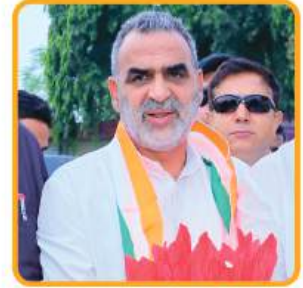
Dr. Sanjeev Balyan

The event was inaugurated by Dr. Sanjeev Balyan, Ex-Cabinet Minister, Government of India. A distinguished leader and advocate of farmer welfare, Dr. Balyan commended the initiative for bridging the gap between technology and traditional agriculture.