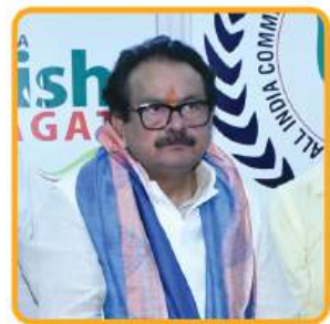
Shri S.P. Baghel

The closing ceremony was graced by Shri S. P. Baghel, Hon'ble Minister, Government of India. In his valedictory address, Shri Baghel praised the successful organization of the Expo and lauded the active participation of farmers, startups, and government bodies.