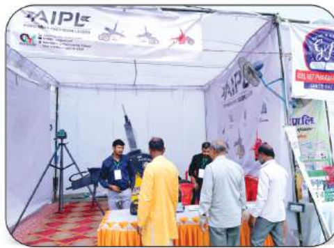
Agro India Precision Lasers