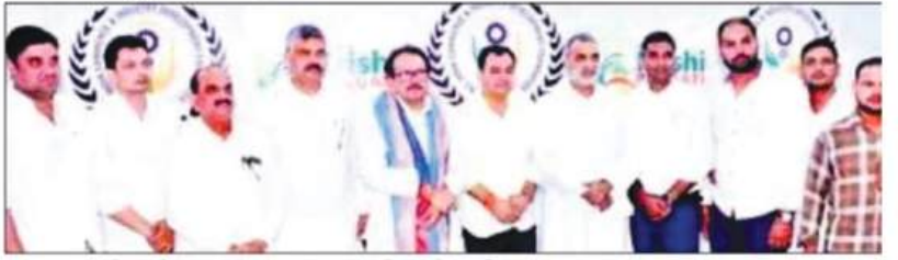
नवीन मंडी में आयोजित कार्यक्रम में केंद्रीय मंत्री एसपी सिंह बघेल एवं अन्य अतिथि।