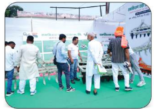
Ramkishan Agri Innovate Pvt. Ltd.