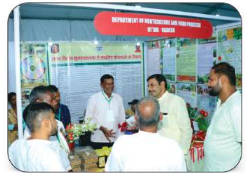
Department of Horticulture and Food Processing, Uttar Pradesh